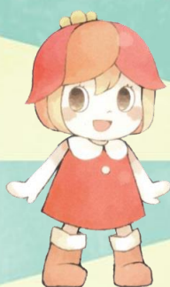
あけぼの山農業公園 オリジナルキャラクター あけぼん